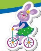
Hare – [heə] – zając