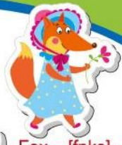
Fox – [fɒks] – lis