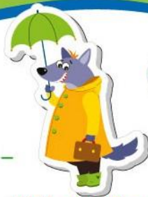
Wolf – [wʊlf] – wilk